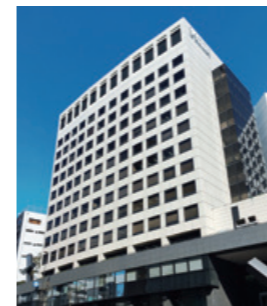
麻布台オフィス(東京都 港区)

●本社 〒160-8315 東京都新宿区西新宿7-5-20 Tel. 03-3366-7845