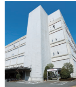
東京流通センター(東京都 品川区)