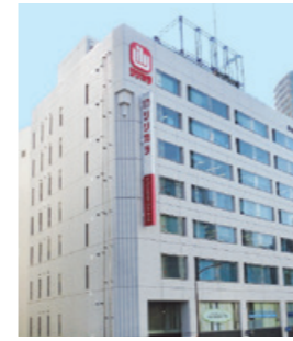
本社(東京都 新宿区)