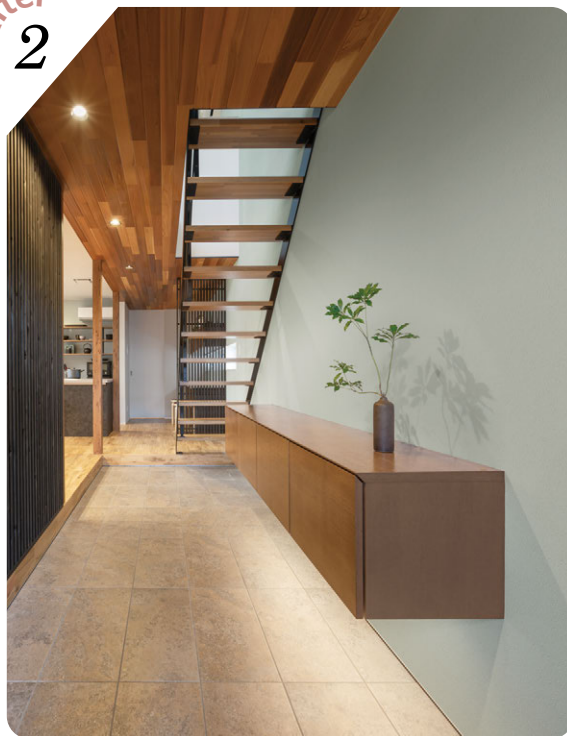
壁 (右): LRP-70609