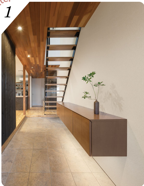
壁 (右): LRP-70617