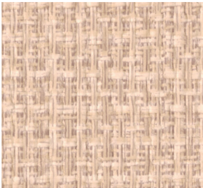
XR-569 19-21 XR XR-349 防火種別 2-3 準不燃 巾92.5cm切売可 リビート：32 ↔ 30.8cm プリントリビート