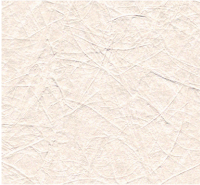
XR-566 防火種別 2-3 準不燃 巾92cm切売可