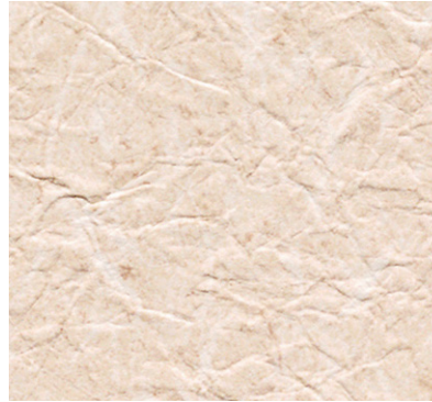
XR-567 19-21 XR XR-348 防火種別 2-3 準不燃 巾92cm切売可