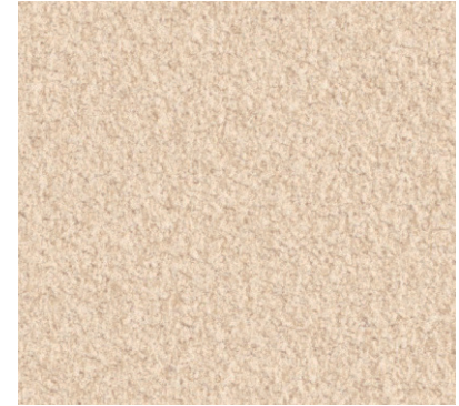
XR-568 NEW 防火種別 2-3 準不燃 巾92cm切売可