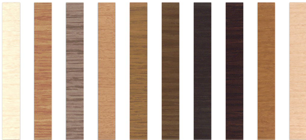
HL70 HL71 HL72 HL73 HL74 HL75 HL76 HL77 HL78 HL79