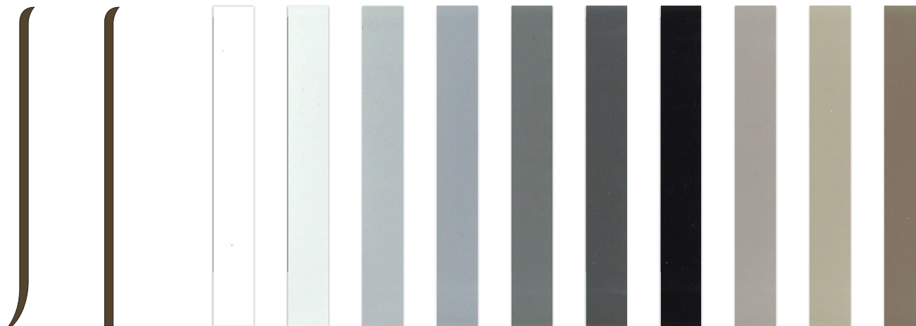
Rアリ断面図 Rナシ断面図 HL52 HL51 HL65 HL66 HL67 HL68 HL69 HL64 HL56 HL59